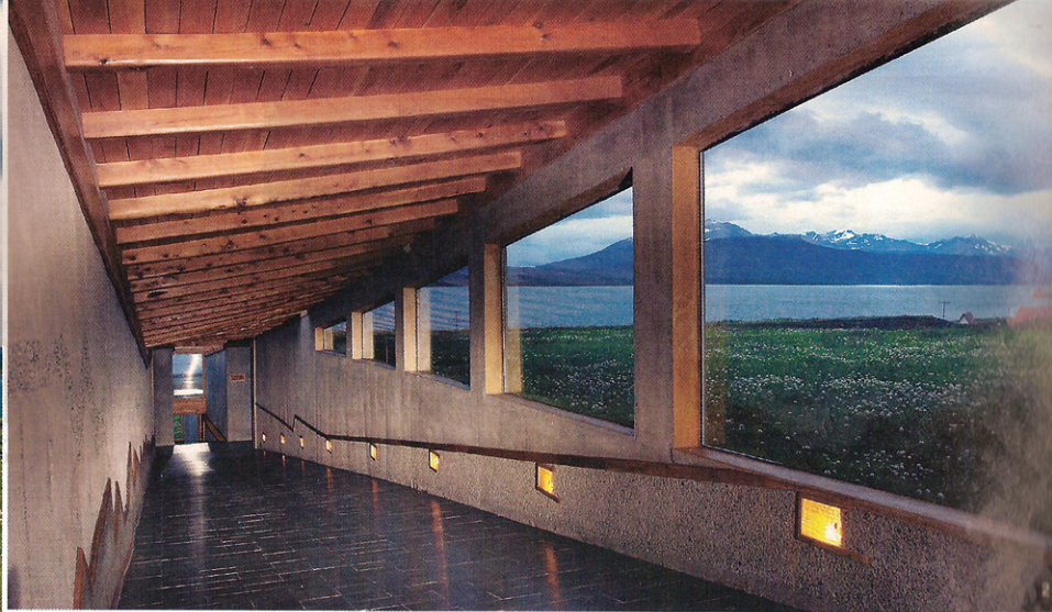
1- La guarda que cubre el edificio es de ciprés y el revestimiento de champa de pasta. / 2- El Altiplánico Sur está en la zona Los Huertos, cerca del terminal del Skorpios, del glaciar Balmaceda y a 3 kilómetros del centro de Puerto Natales.