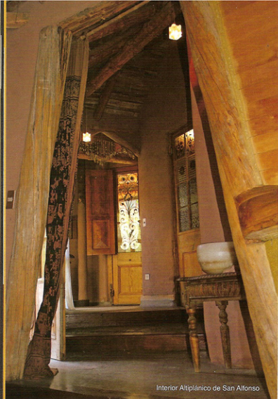
Interior Altiplánico de San Alfonso